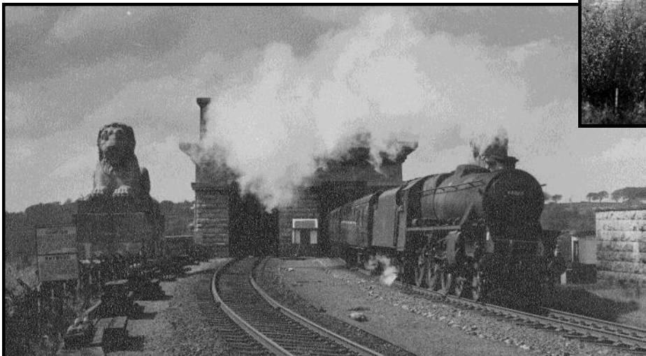
Llawer o ddiolch i Norman Kneale, am adael i ni ddefnyddio'i luniau o'i gasgliad, cofnod unigryw.