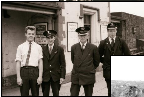
Pwy yw'r rhain?